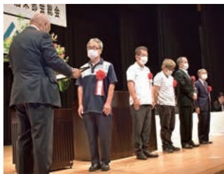
▲総会では栽培優秀者が表彰されました。

高宮町は広島県内最大の酒米産地として、全量契約栽培で八反錦1号など5品種の酒造好適米を栽培し、県内外の酒造メーカーへ供給しています。コロナが2類感染症から5類感染症へ変更になったことや日本へのインバウンドの再開、またG7での会食や国際メディアセンター等へ広く日本酒が紹介されたことなどから日本酒の