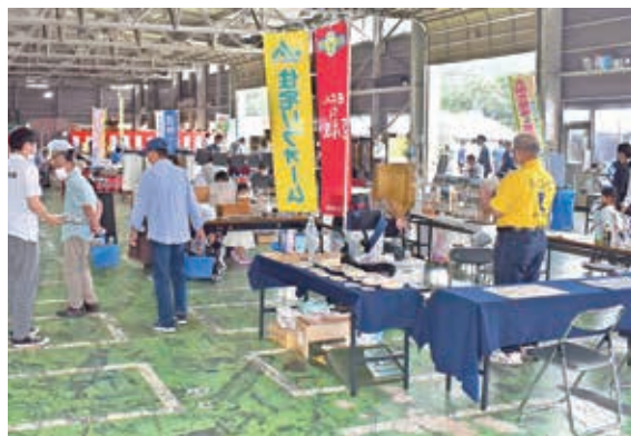
▲JAでは仏壇や墓石、住宅リフォームなど様々な商品を取り扱っています。

毎年恒例の夏の総合展示相談会を7月7日、8日の2日間、営農総合センターで開催し、生活購買品や農機具などの展示や営農相談コーナーなど相談ブースを設けました。会場内には昨年に続き女性や子どもも楽しめるワイヤークラフトやアロマ教室も開かれ、また、4年ぶりに女性部によるうどんが振舞われた他、カレーのキッチンカーも来場しました。雨の中でしたが、ご来場いただいたみなさまありがとうございました。