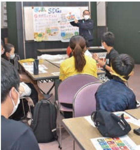
▲JAひろしまは、SDGsに取り組んでいます。(エコミュージアム川根にて)

広島北部地域本部では、「わんぱく大作戦プロジェクト」が主催する「わんぱく農業体験」で、次世代を担う子どもたちにSDGsを意識しながら農業体験に取り組んでほしいと、参加した小学生18人に田や畑が果たす役割や食料自給率について話しました。